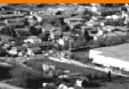
Fonti di pressione