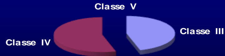
Ripartizione tirocinanti per classi