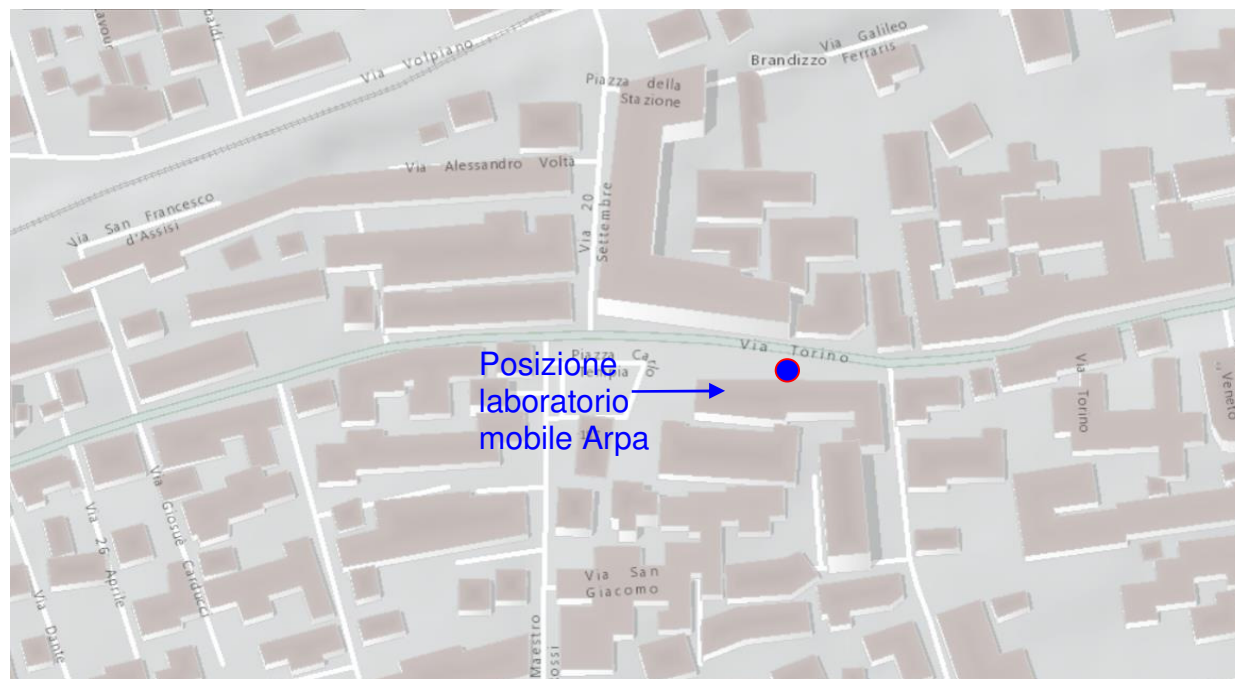
Figura 3: Ubicazione del Laboratorio Mobile per il monitoraggio della qualità dell'aria nel comune di Brandizzo.