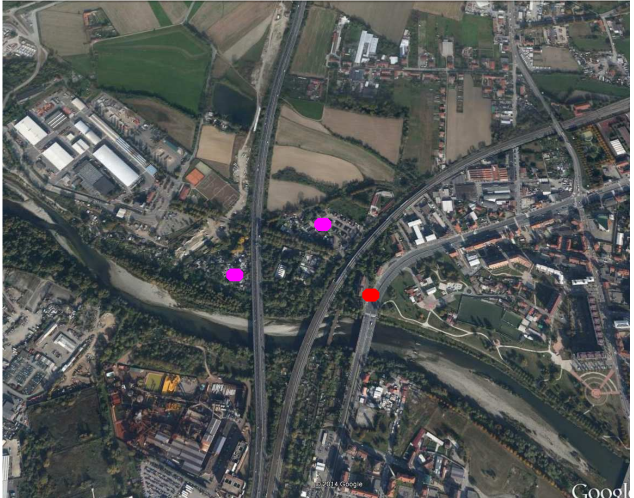
Figura 1 : ubicazione geografica dell'abitazione di via Germagnano, 1